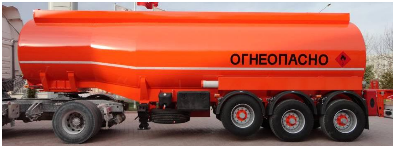
Рисунок 1 - Общий вид полуприцепа-цистерны переменного сечения Nursan-ППЦ-32

Общие виды ППЦ представлены на рисунках 1 и 2.