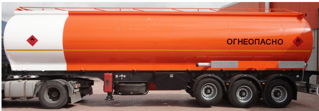
Рисунок 2 - Общий вид полуприцепа-цистерны постоянного сечения Nursan-ППЦ-32

Схема пломбировки для защиты от несанкционированного изменения положения указателя уровня налива, обозначение места нанесения знака поверки представлены на рисунке 3.