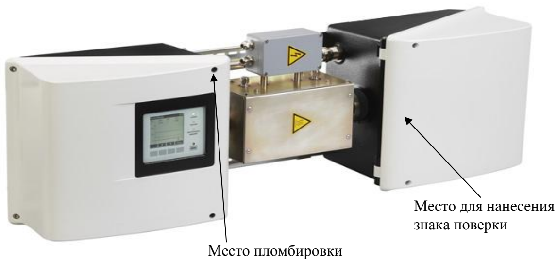
Рисунок 1 - Общий вид анализаторов фотометрических MCS300P с кюветой PGK