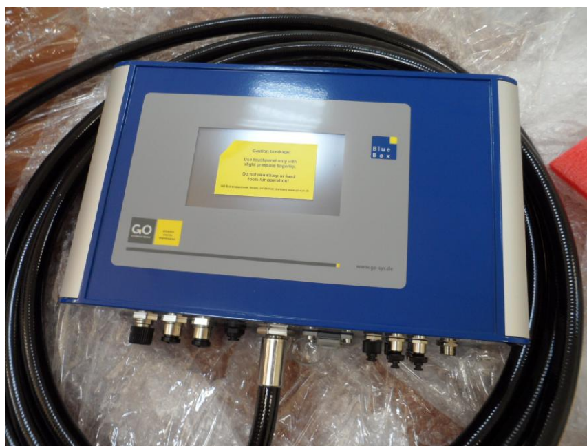
Рисунок 2 - Общий вид контроллера BlueBox