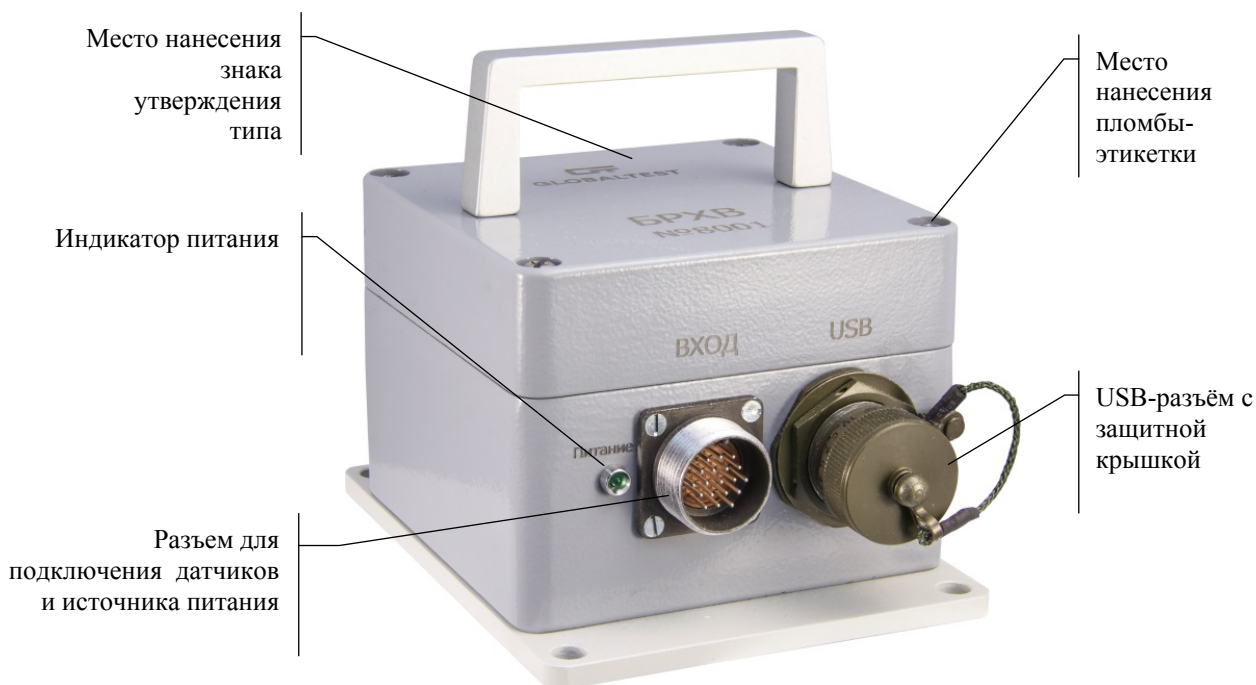
а) Расположение разъемов управления и подключения