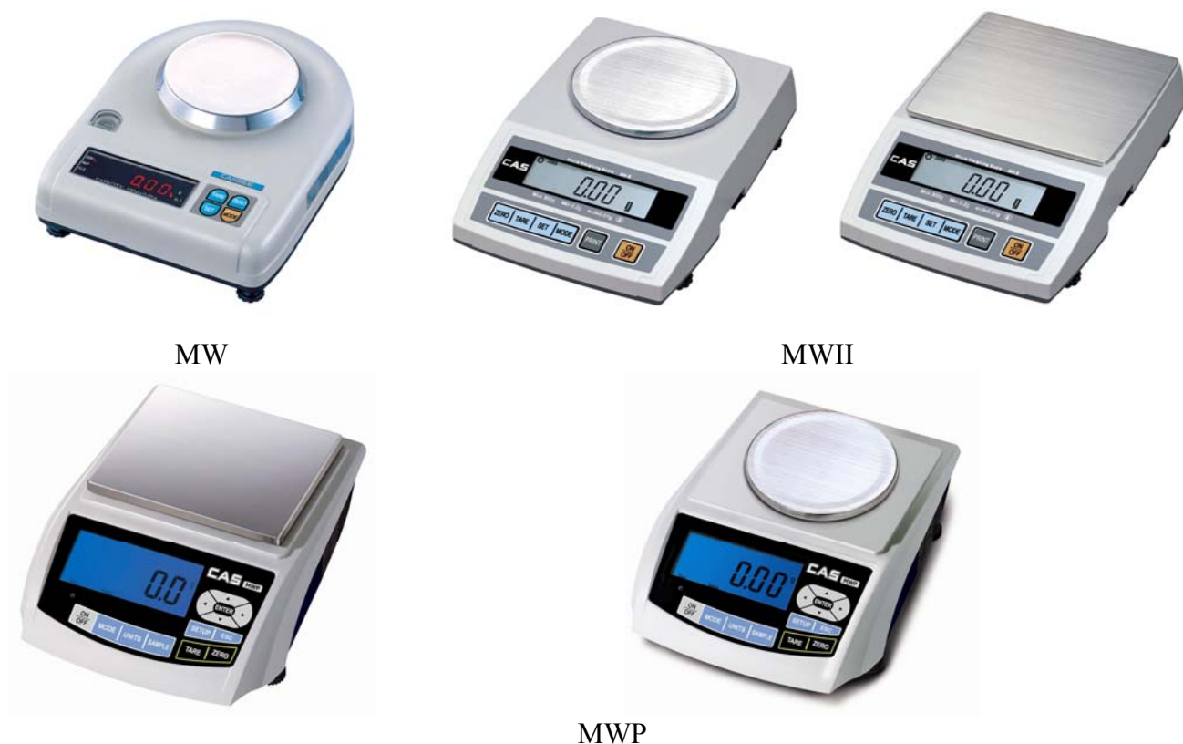
Рисунок 1 - Общий вид весов электронных MW, MWII, MWP

Общий вид весов представлен на рисунке 1.