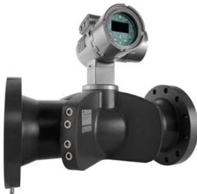
Рисунок 1 - Общий вид расходомеров-счетчиков жидкости ультразвуковых Sentinel LCT4

Схема пломбировки от несанкционированного доступа, обозначение места нанесения знака поверки представлены на рисунке 2.