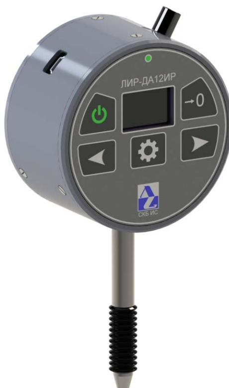
Рисунок 1 - Общий вид индикаторов цифровых со штоком ЛИР-ДА12ИР

Общий вид индикаторов представлен на рисунке 1.