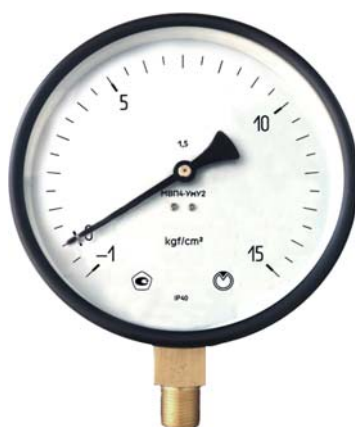
Рисунок 1 - Общий вид приборов

Общий вид приборов приведен на рисунке 1. Схема обозначения мест пломбировки от несанкционированного доступа и нанесения знака поверки приведена на рисунке 2.