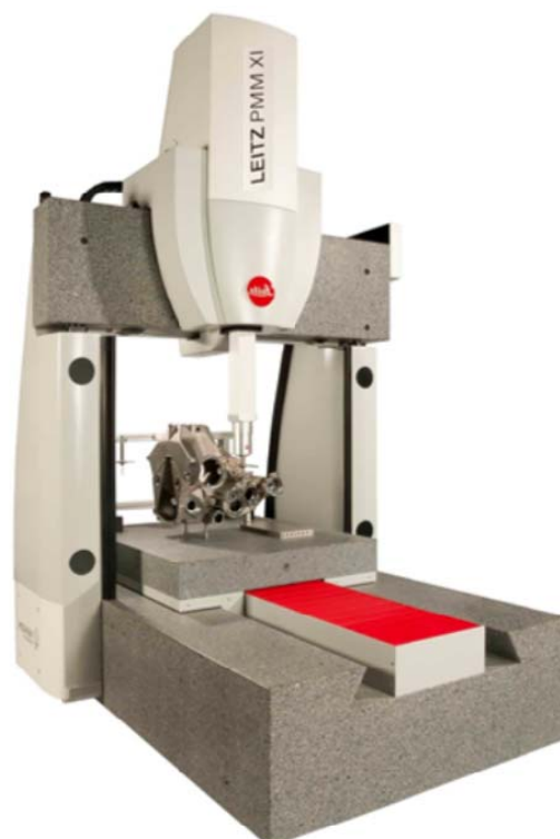
Рисунок 5 - Общий вид машин Leitz PMM-Xi