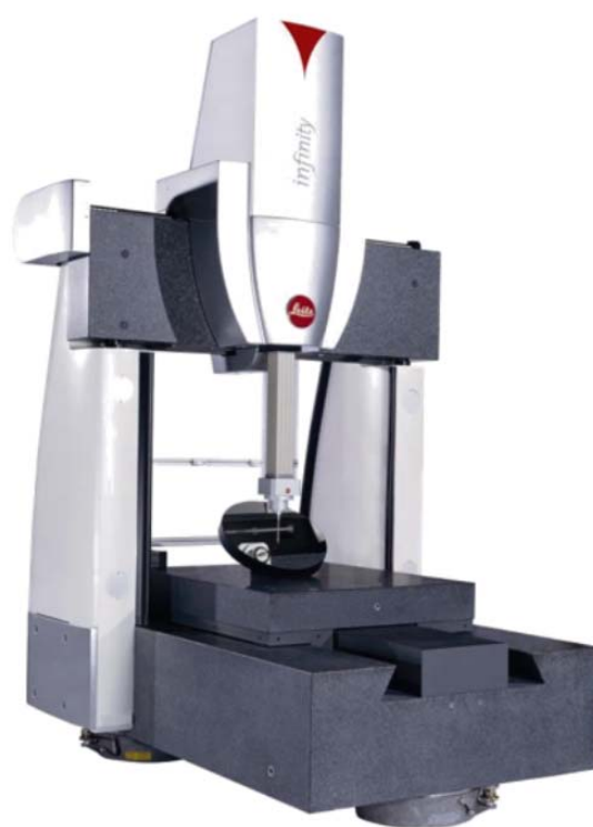
Рисунок 3 - Общий вид машин Leitz Infinity