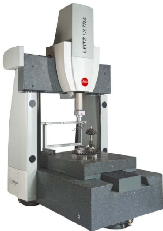
Рисунок 4 - Общий вид машин Leitz Ultra