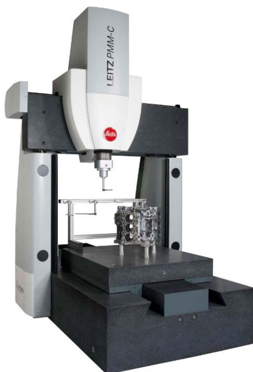
Рисунок 2 - Общий вид машин Leitz PMM-C