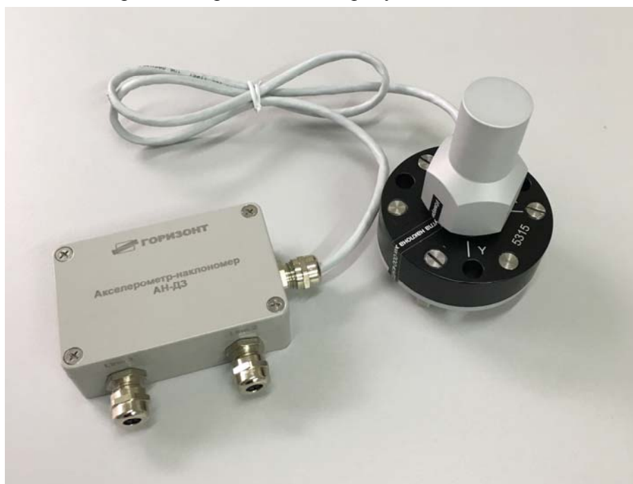
Рисунок 1 - Внешний вид акселерометров-наклонометров двухкоординатных АН-ДЗ

Внешний вид измерителей представлен на рисунке 1.