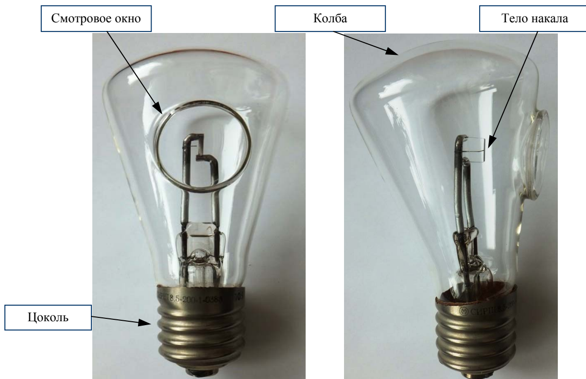
Рисунок 2 - Общий вид излучателя на основе лампы СИРШ