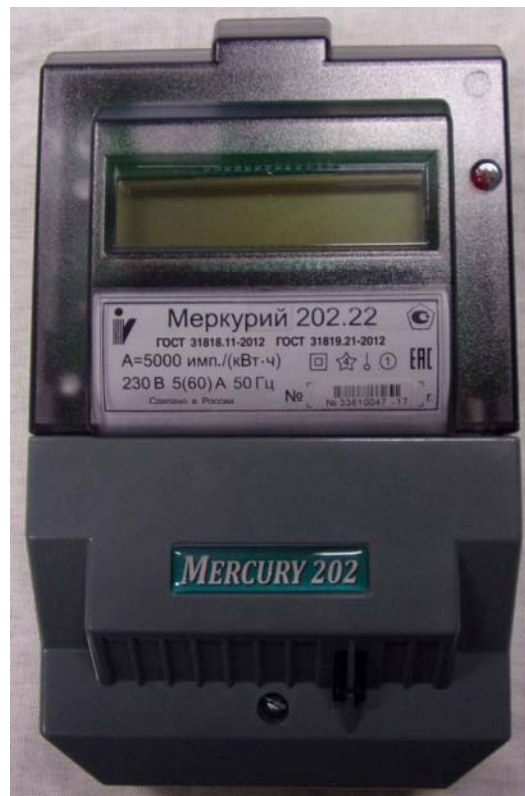
Рисунок 2 - Общий вид счетчика с ЖКИ