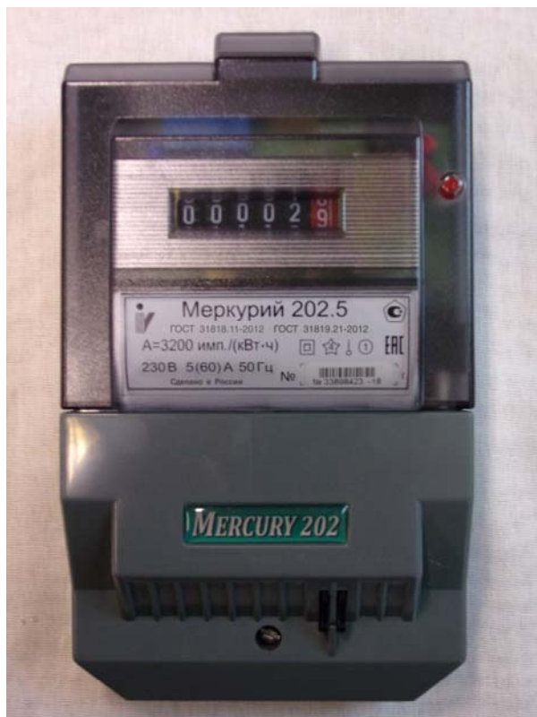
Рисунок 1 - Общий вид счетчика с УО