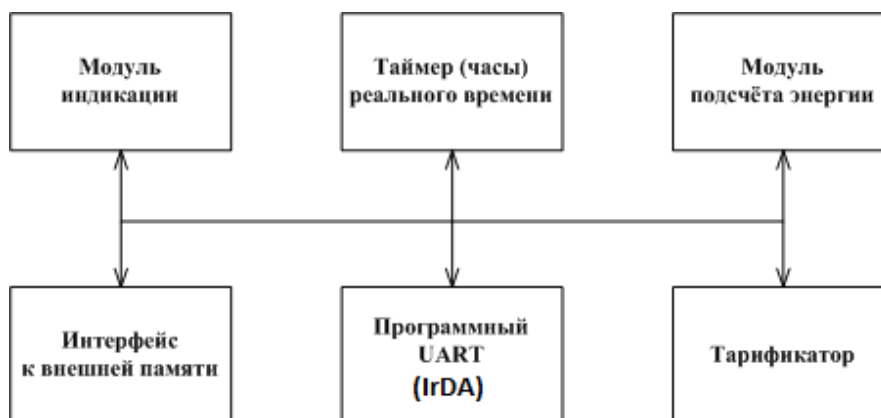
Рисунок 4 - Структура программного обеспечения счётчиков

Структура программного обеспечения «Меркурий 202» приведена на рисунке 4.