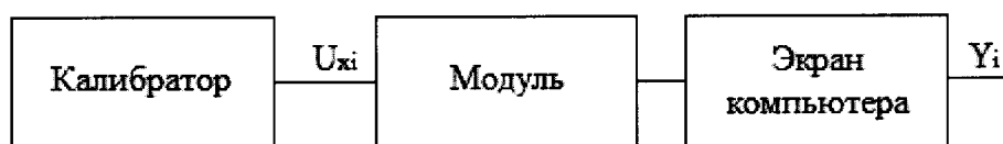
Рисунок 3 - Схема подключений при определении погрешностей ИК, реализующих аналого-цифровое преобразование сигналов от термопар

8.4.3.5 Проверяемый ИК считают успешно прошедшим проверку, если в каждой из проверяемых точек выполняется неравенство |\Delta_i| < |\Delta| , где \Delta – пределы допускаемой основной абсолютной погрешности, приведенные в описании типа.