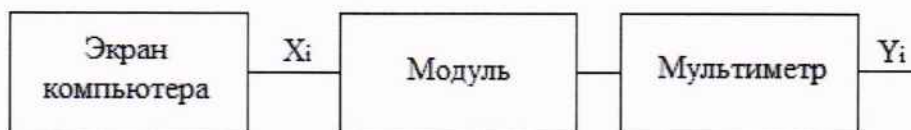
Рисунок 4 - Схема подключений при определении погрешностей ИК, реализующих линейное цифро-аналоговое преобразование сигналов силы и напряжения постоянного электрического тока

8.4.4.4 Проверяемый ИК считают успешно прошедшим испытания, если в каждой из проверяемых точек выполняется неравенство |\gamma_i| < |\gamma| , где \gamma – пределы допускаемой основной приведенной погрешности, приведенные в описании типа.