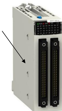
в) модификации ВМХАRT0814RU, ВМХАRT0814HRU