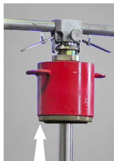
Рисунок 4 - Место пломбировки груза