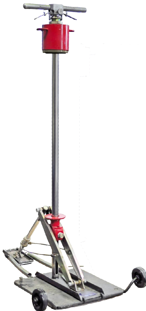
Рисунок 1 - Внешний вид измерителя