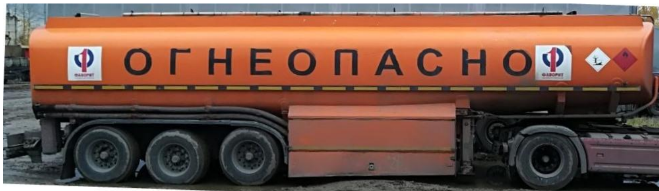
Рисунок 1 - Общий вид полуприцепа-цистерны SCHWINGENSCHLOGEL

Схема пломбировки для защиты от несанкционированного изменения положения указателя уровня налива, обозначение места нанесения знака поверки представлены на рисунке 2.