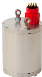
Сейсмометр в водонепроницаемом корпусе