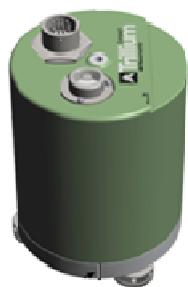
Сейсмометр в стандартном корпусе

Общий вид сейсмометров и блока регистрации представлен на рисунке 1. Вид блока регистрации сзади с местом пломбирования представлен на рисунке 2.