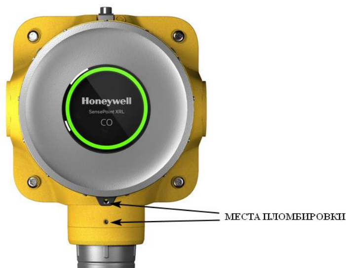
Рисунок 2 - Общий вид газоанализаторов Sensepoint XRL и схема пломбировки от несанкционированного доступа