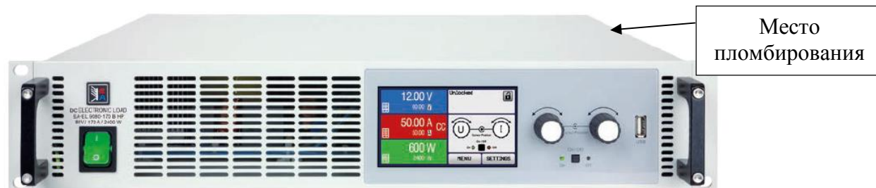
Рисунок 2 - Общий вид и место пломбирования нагрузок серии EA-EL 9000 B HP