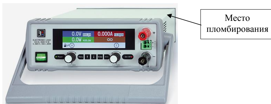
Рисунок 5 - Общий вид и место пломбирования нагрузок серии EA-EL 3000 В