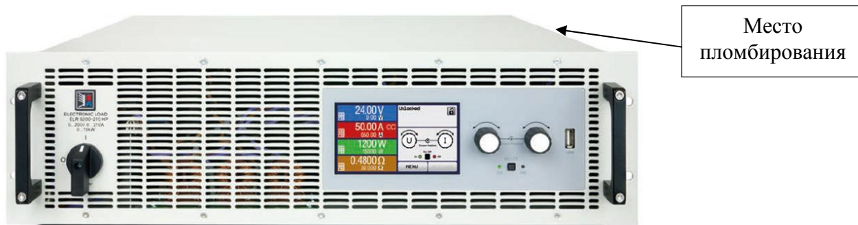
Рисунок 1 - Общий вид и место пломбирования нагрузок серии EA-ELR 9000 HP