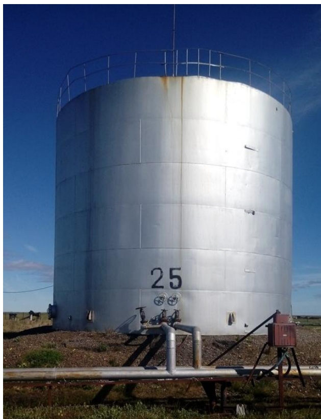
Рисунок 1 - Общий вид резервуара РВС-700

Общий вид резервуаров стальных вертикальных цилиндрических РВС-700, РВС-2000, РВС-3000 представлен на рисунках: 1, 2, 3.