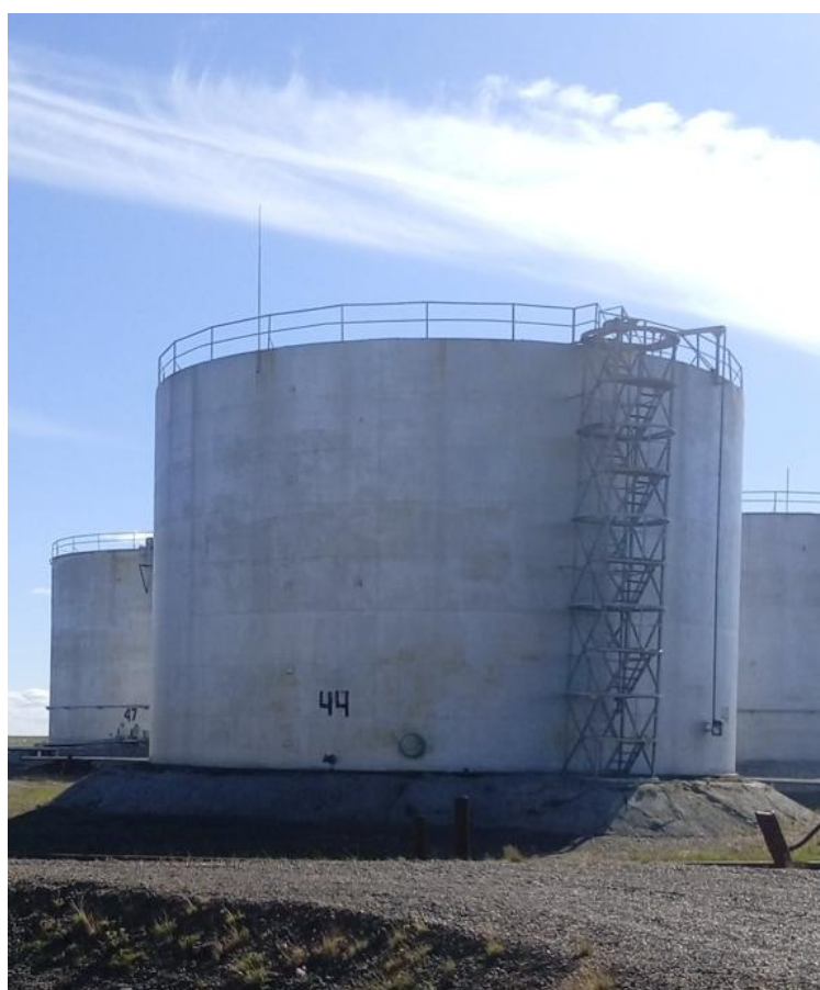
Рисунок 3 - Общий вид резервуара РВС-3000

Пломбирование резервуаров стальных вертикальных цилиндрических РВС-700, РВС-2000, РВС-3000 не предусмотрено.