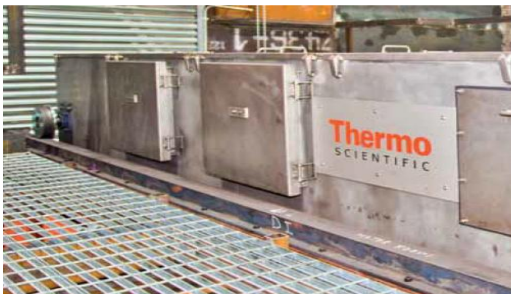
Рисунок 1 - Верхняя часть измерителя