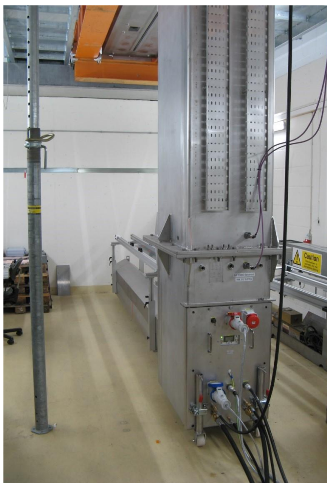
Рисунок 2 - Средняя и нижняя части измерителя