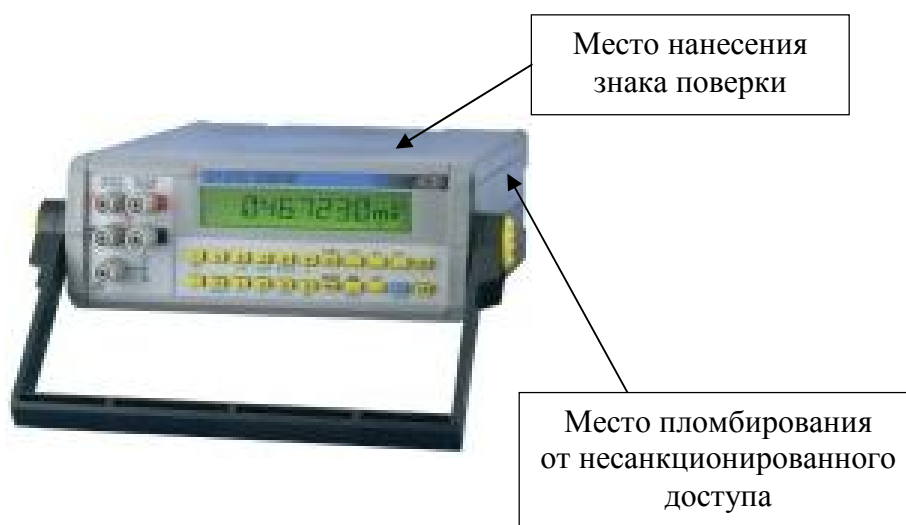
е) калибраторы модификации SN 8310R