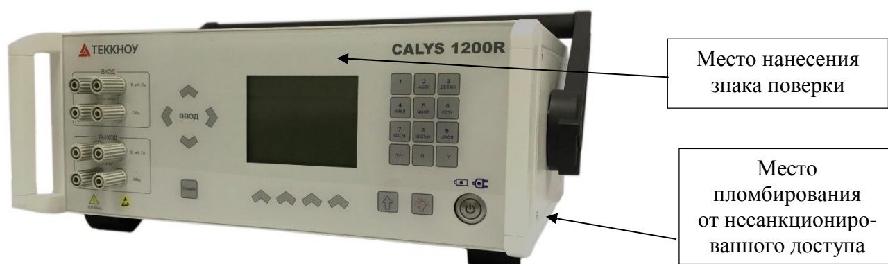
ж) калибраторы модификаций Calys 1000R, Calys 1200R, Calys 1500R