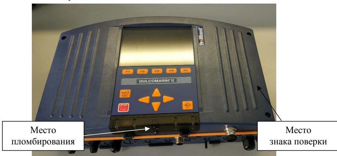
Анализатор DULCOMARIN II