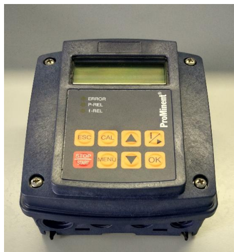
Анализатор DCCA (compact)