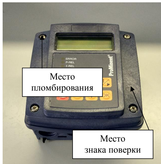
Анализатор DCCa (compact)