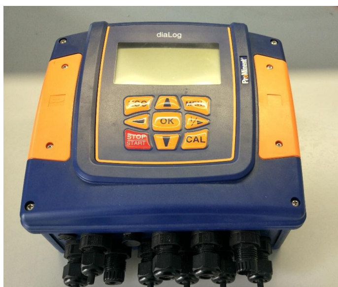
Анализатор Dialog DAC