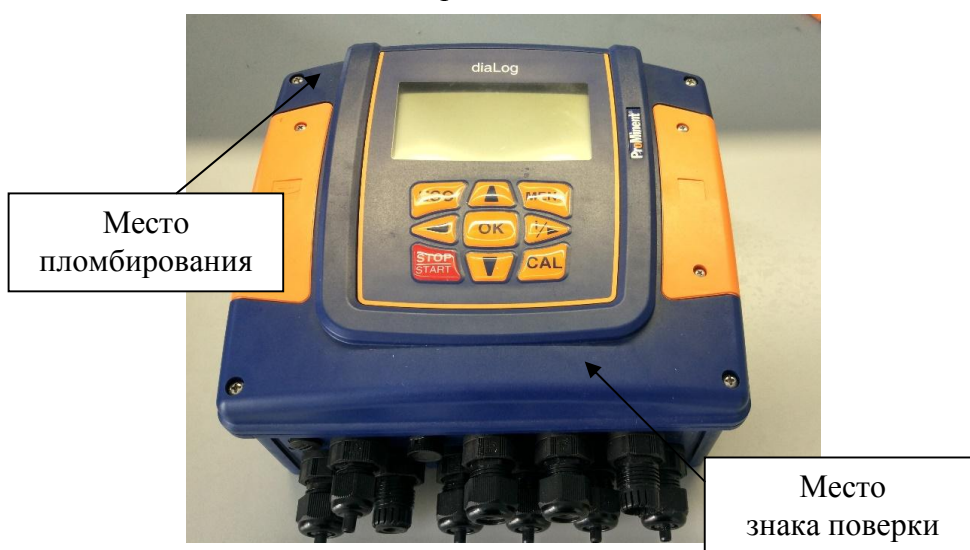
Анализатор Dialog DAC