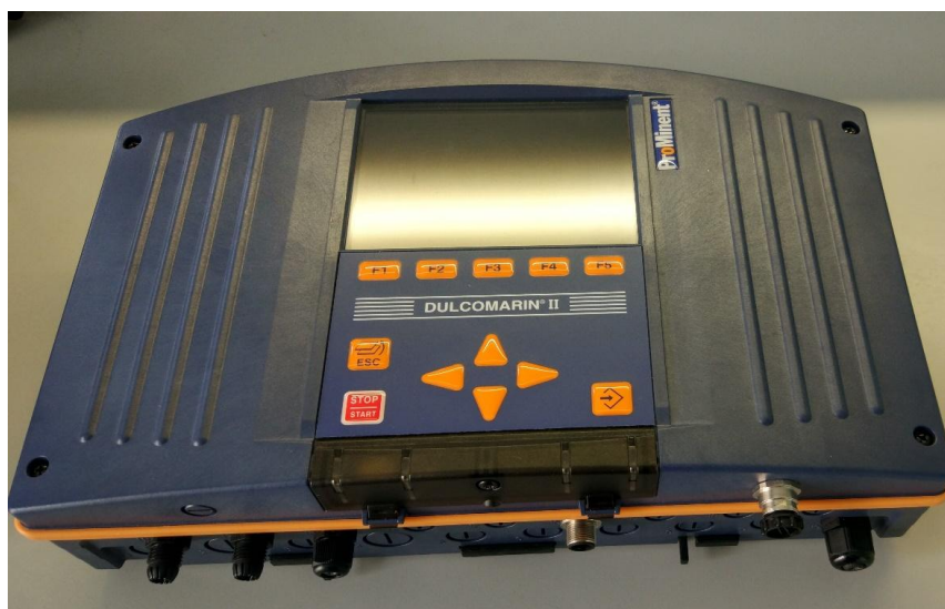
Анализатор DULCOMARIN II