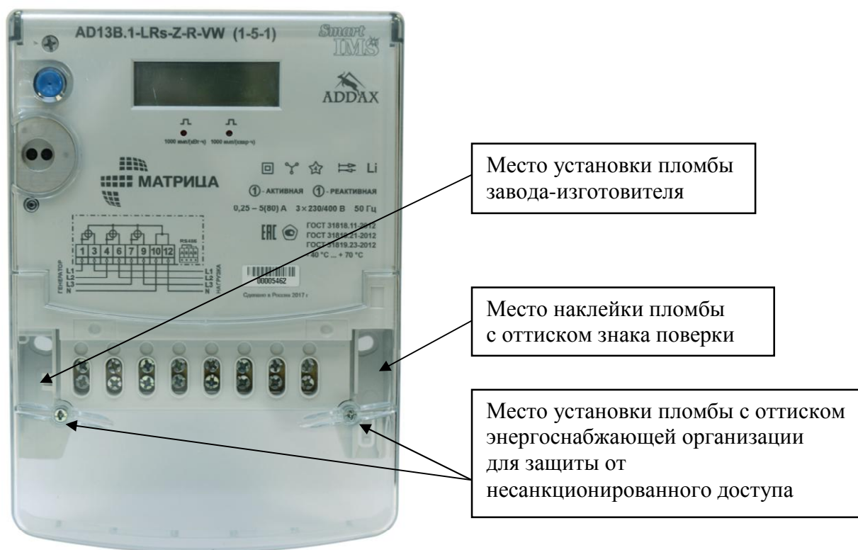
Рисунок 2 - Общий вид счетчика и схема пломбировки от несанкционированного доступа в корпусе типа «классический тонкий», разрушаемом при вскрытии