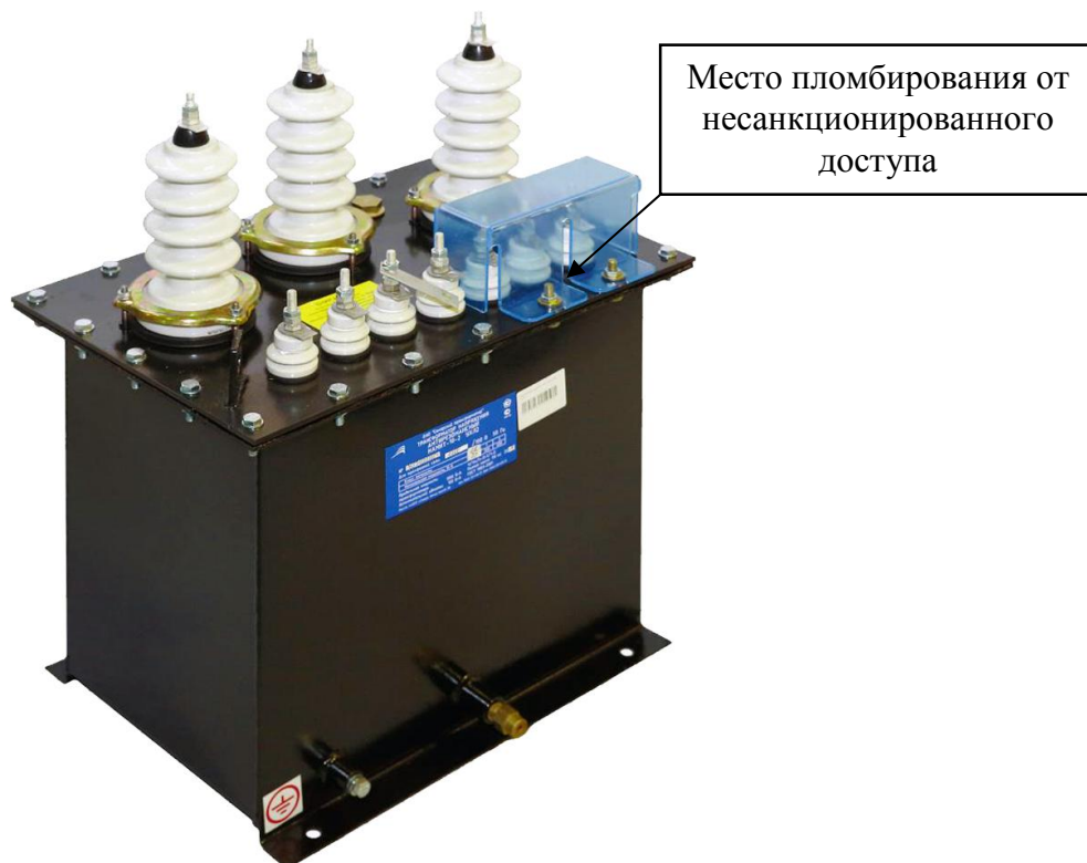
Рисунок 1 - Фотография общего вида с указанием места пломбировки от несанкционированного доступа трансформаторов модификаций НАМИТ-6, НАМИТ-10