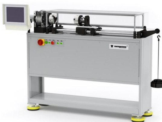
Рисунок 4 - Общий вид машин КТС 405-НХ напольного исполнения

Для предотвращения несанкционированного доступа производится опломбирование пульта оператора машин. Схема пломбировки от несанкционированного доступа пульта оператора представлена на рисунке 5.