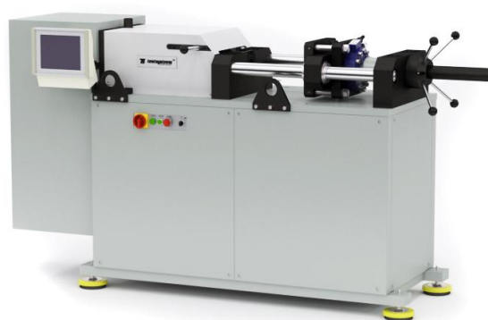
Рисунок 3 - Общий вид машин КТС 405-Х/ПГ/25(100)-СХ напольного исполнения