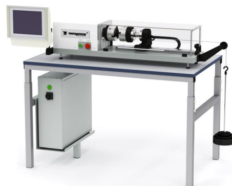
Рисунок 2 - Общий вид машин КТС 405-Х/ПГ25(100)-НХ настоьного исполнения