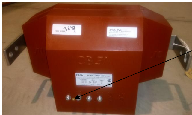
Рисунок 3 - Общий вид трансформаторов тока ТПОЛ-СВЭЛ-10