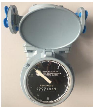
Рисунок 1 - Общий вид счетчиков с овальными шестернями модели 9402

Схема пломбировки от несанкционированного доступа, обозначение места нанесения знака поверки представлены на рисунке 2.