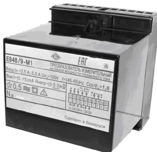
Рисунок 1 – Внешний вид ИП

Фотография общего вида ИП приведена на рисунке 1, схема пломбировки от несанкционированного доступа, с указанием места для нанесения оттиска клейма ОТК и места нанесения знака поверки на ИП приведены на рисунке 2.