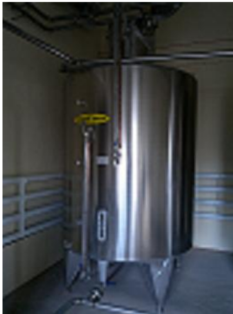
Рисунок 1 - Общий вид мерников

Общий вид мерников приведен на рисунке 1.