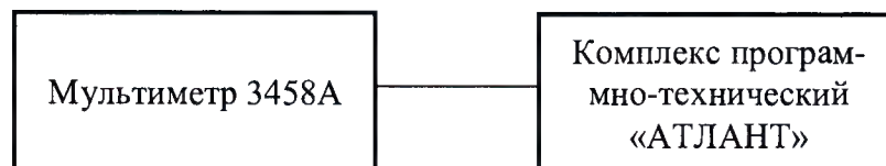
Рисунок 2 – Структурная схема определения основной приведенной (к диапазону измерений) погрешности воспроизведений силы и напряжения постоянного тока

3) подключить 3458А к ПТК согласно структурной схеме, представленной на рисунке 2;