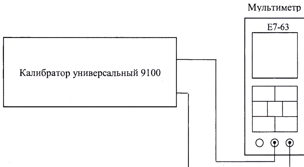
Рисунок 1 – Структурная схема опробования и определения погрешностей измерений напряжения и силы* постоянного тока, среднеквадратического значения напряжения переменного тока, электрического сопротивления постоянному току

Примечание - * - для диапазона 10 А использовать гнездо, расположенное слева