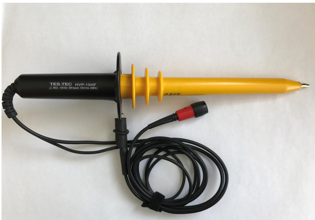
Рисунок 1 - Общий вид делителя импульсных напряжений высоковольтного TESTEC HVP-15HF

Пломбирование делителя импульсных напряжений высоковольтных TESTEC HVP-15HF не предусмотрено.