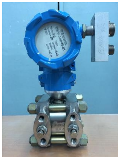
Рисунок 2 - Общий вид преобразователей моноблочных моделей 2420, 2430, 2440, 2450, 2460