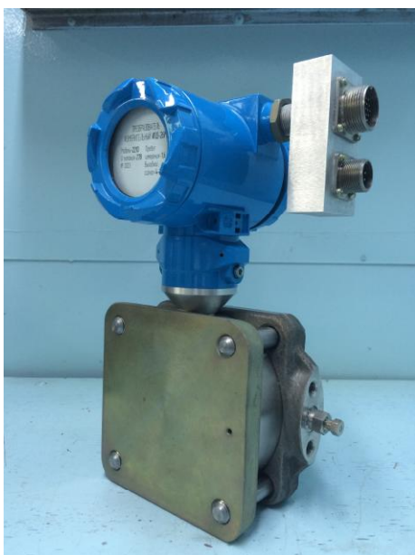
Рисунок 1 - Общий вид преобразователей моноблочных моделей 2020, 2030, 2040, 2110, 2120, 2130, 2140, 2210, 2220, 2230, 2240, 2330, 2340, 2405, 2410