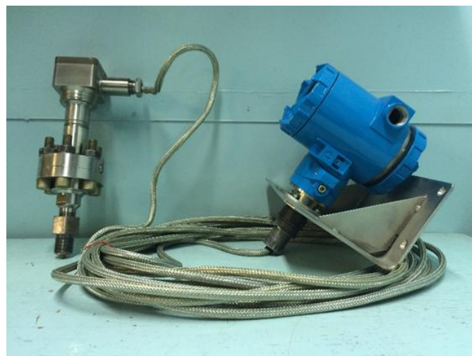
Рисунок 4 - Общий вид преобразователей с разделенными МБ и БЭП моделей 2050, 2060, 2070, 2150, 2160, 2170, 2350, 2360