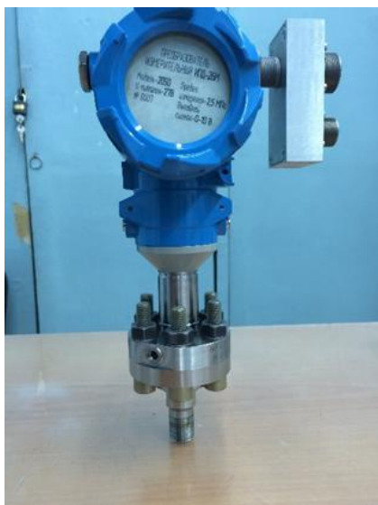
Рисунок 3 - Общий вид преобразователей моноблочных моделей 2050, 2060, 2070, 2150, 2160, 2170, 2350, 2360