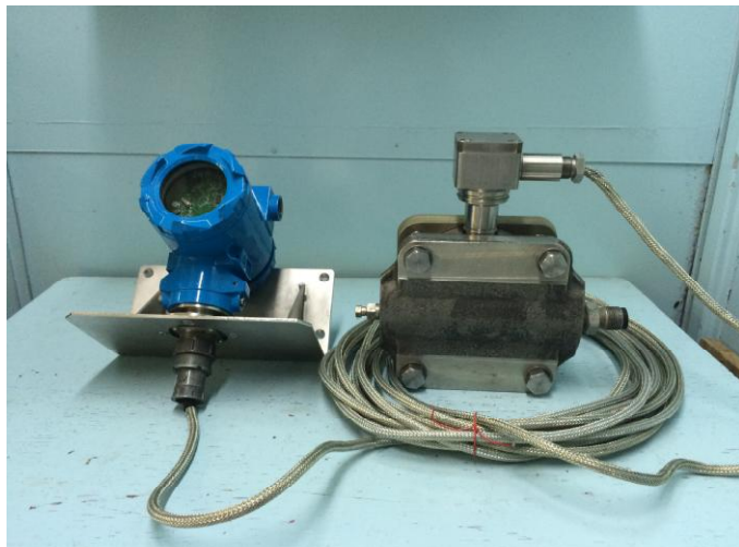
Рисунок 4 - Общий вид преобразователей с разделенными МБ и БЭП моделей 2030, 2040, 2120, 2130, 2140, 2220, 2230, 2240, 2330, 2340, 2345, 2420, 2430, 2440, 2450, 2460, 2020, 2110, 2210, 2405, 2410

Пломбирование преобразователей не предусмотрено.