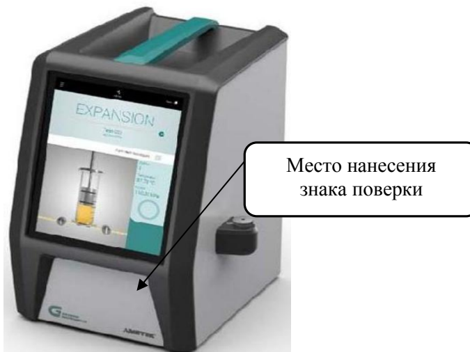
Рисунок 1 - Общий вид анализаторов

Для исключения возможности от несанкционированного доступа анализатор защищен двумя пломбами, расположенными на дне анализатора и представленными на рисунке 2.