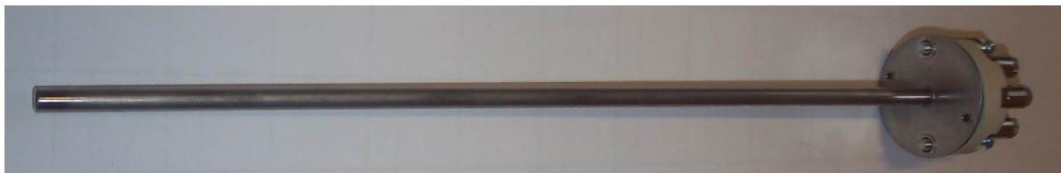
Рисунок 7 - Общий вид термопреобразователей сопротивления платиновых модели 20 (20M)