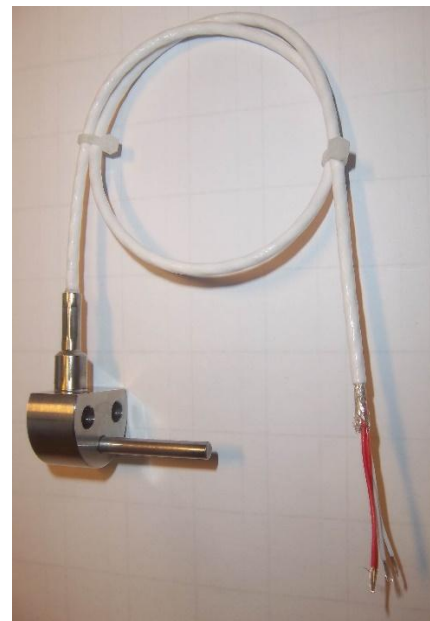
Рисунок 13 - Общий вид термопреобразователей сопротивления платиновых модели Ex21w