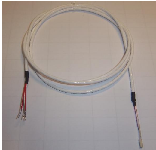
Рисунок 11 - Общий вид термопреобразователей сопротивления платиновых серии 10K