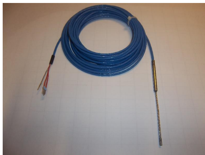
Рисунок 15 - Общий вид термопреобразователей сопротивления платиновых модификации Ex21A