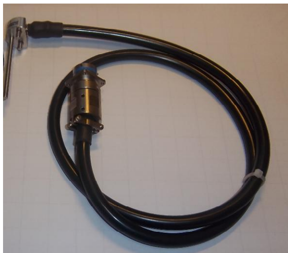
Рисунок 8 - Общий вид термопреобразователей сопротивления платиновых модели 21wx модификации 21w5