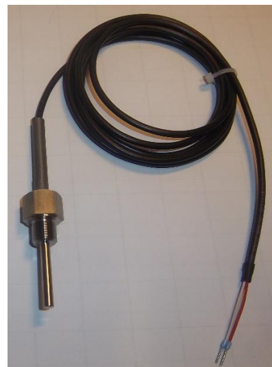
Рисунок 6 - Общий вид термопреобразователей сопротивления платиновых модели 26х модификации 26G