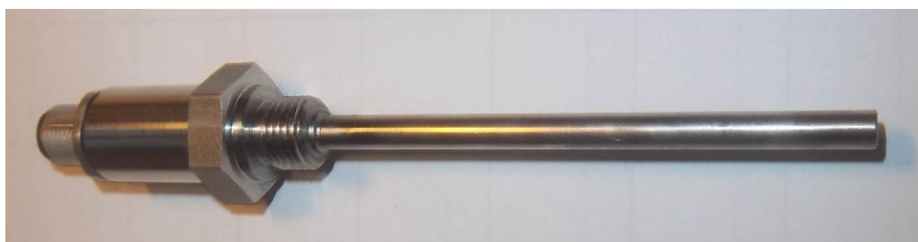
Рисунок 12 - Общий вид термопреобразователей сопротивления платиновых модели 211Vi