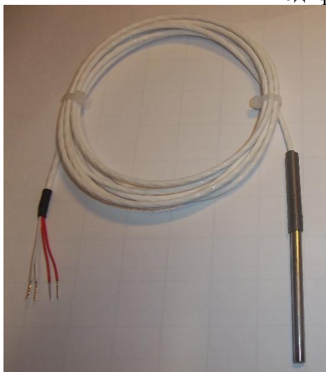
Рисунок 5 - Общий вид термопреобразователей сопротивления платиновых модели 21х модификации 21А