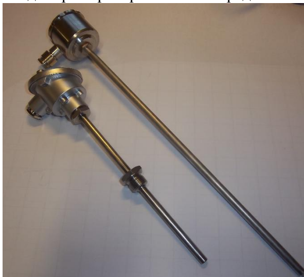
Рисунок 2 - Общий вид термопреобразователей сопротивления платиновых модели 2xx модификаций 221и 212BR55

Фотографии общего вида термопреобразователей представлены на рисунках 1-15.