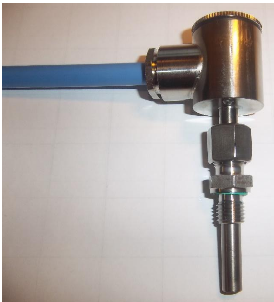
Рисунок 12 - Общий вид термопреобразователей сопротивления платиновых модели Ex2xx модификации Ex223