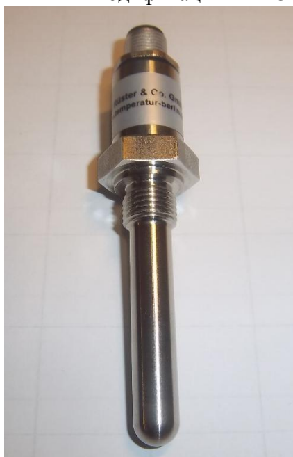
Рисунок 14 - Общий вид термопреобразователей сопротивления платиновых модели Ex211Vi