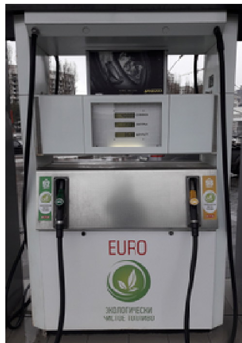
Исполнение ВМР 2000