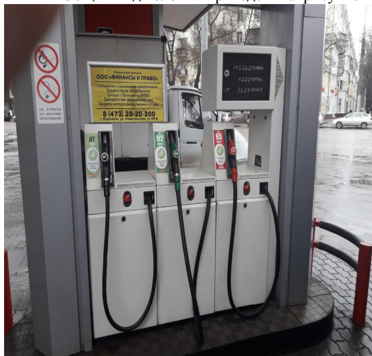
Исполнение ВМР 1000

Общий вид колонки приведен на рисунке 1, места пломбирования на рисунках 2 – 3.