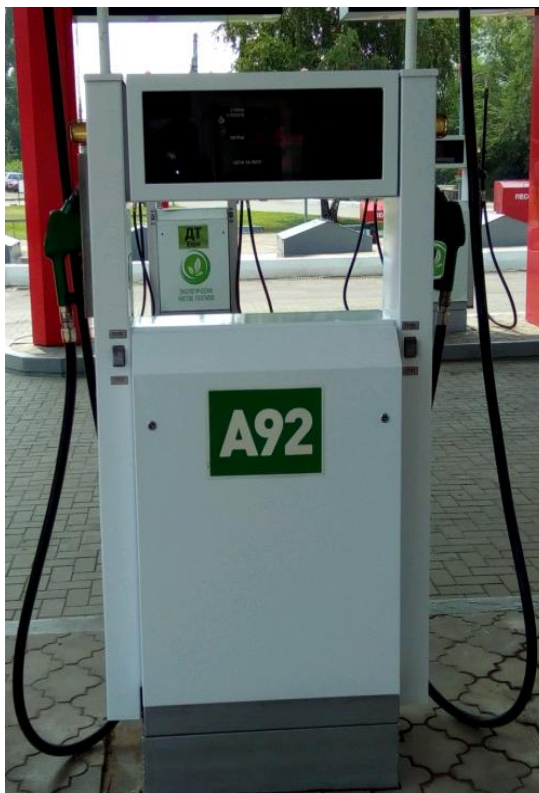
Рисунок 1 – Общий вид колонки

Общий вид колонки приведен на рисунке 1, схема и место пломбирования на рисунке 2.