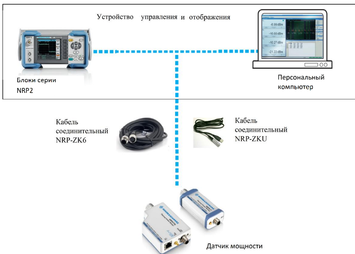
Рисунок 1 - Внешний вид ваттметров