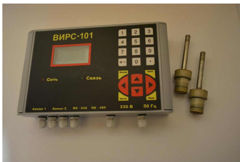
Рисунок 2 - Общий вид расходомера-счетчика ультразвукового ВИРС-101 с врезными ПЭА