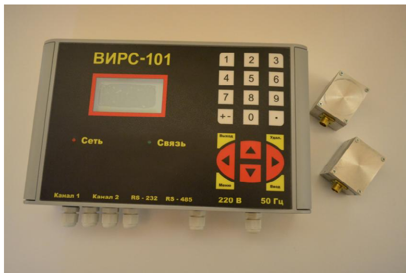
Рисунок 1 - Общий вид расходомера-счетчика ультразвукового ВИРС-101 с накладными ПЭА

Общий вид БЭ счётчика (одинаков для всех исполнений) приведен на рисунках 1, 2; изображены счетчики с накладными и врезными ПЭА соответственно.