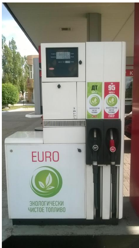
Рисунок 1 – Общий вид колонки

Общий вид колонки приведен на рисунке 1, места пломбирования на рисунках 2 – 3.