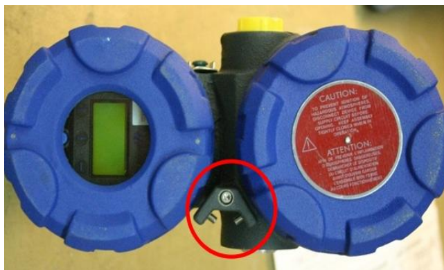
Рисунок 1 – Схема пломбирования ЭБ уровнемера от несанкционированного доступа.

Схема пломбирования электронного блока (ЭБ) уровнемера от несанкционированного доступа представлена на рисунке 1, функциональная схема прибора представлена на рисунке 2, общий вид уровнемеров – на рисунке 3.