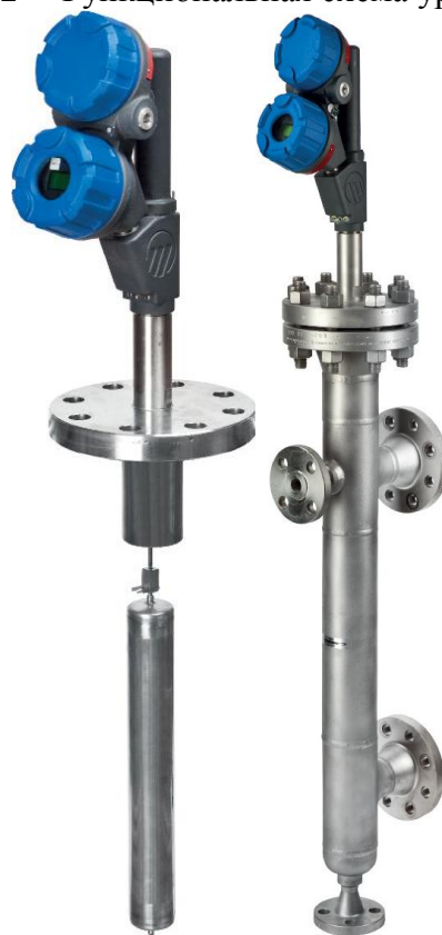
Рисунок 3 – Общий вид уровнемеров