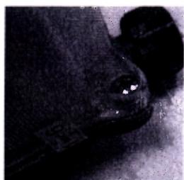
Знак поверки в виде наклейки