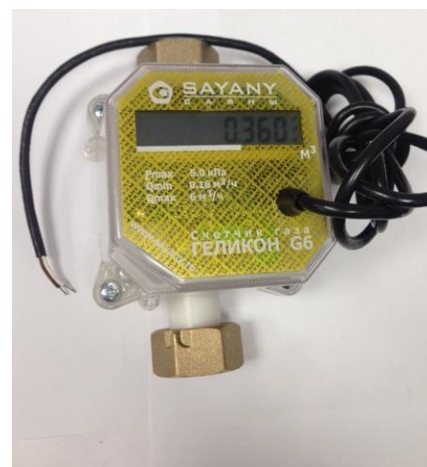
Рисунок 3 - "Геликон п-и"

Счетчик пломбируется разрушающейся наклейкой (Рисунок 4) с клеймом поверителя. Счетчик пломбируется навесной пломбой (Рисунок 5) абонентского отдела.