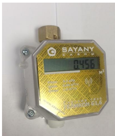
Рисунок 1 - "Геликон п"