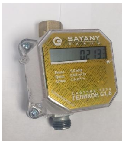
Рисунок 2 - "Геликон м"