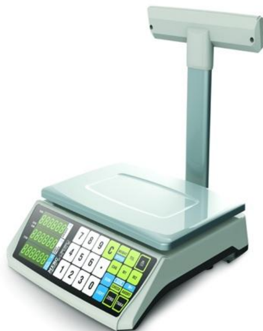
б) исполнение со стойкой