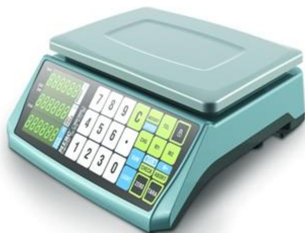
а) исполнение без стойки