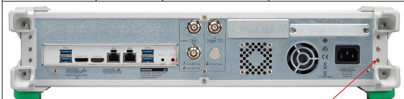
Рисунок 3 – Вид передней панели анализаторов MS46322B

место нанесения знака утверждения типа и знака поверки