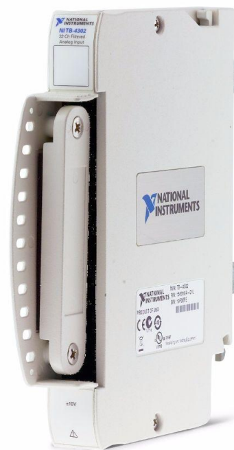
Рисунок 2 – Общий вид терминальных блоков