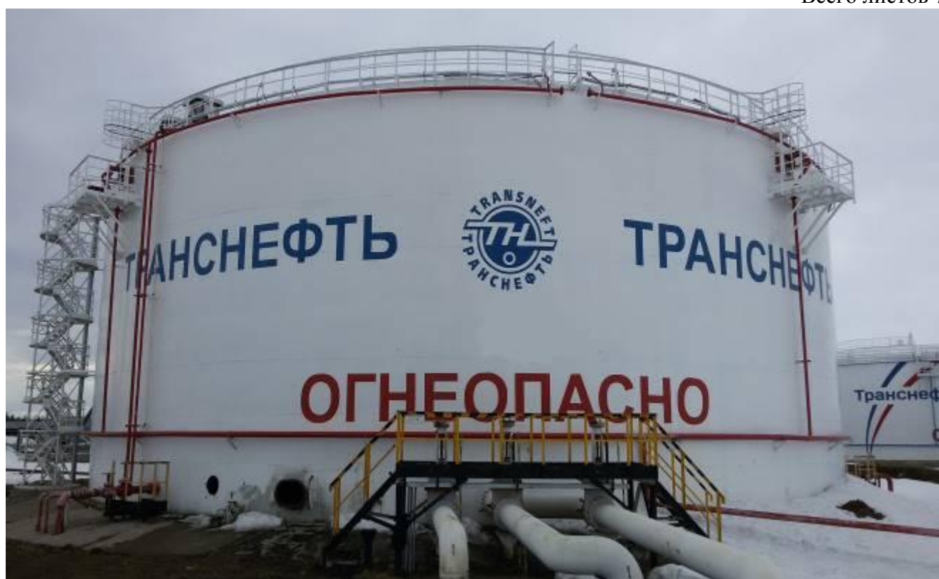
Рисунок 2 – Общий вид резервуара вертикального стального цилиндрического РВС-10000