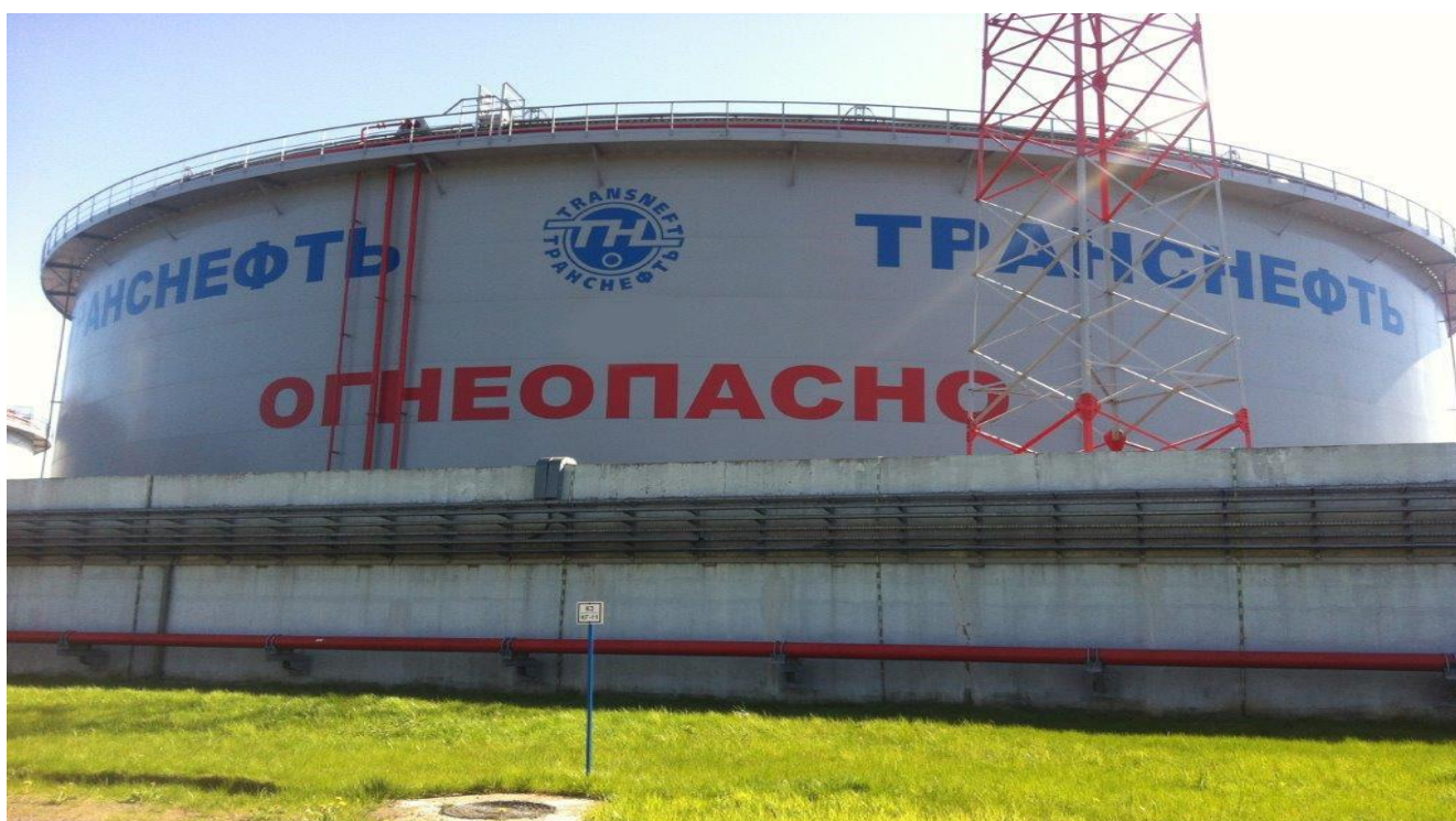
Рисунок 5 – Общий вид резервуара вертикального стального цилиндрического РВСПА-50000 Пломбирование резервуаров вертикальных стальных цилиндрических РВС-5000, РВС-20000, РВСП-20000, РВСПК-50000 и РВСПА-50000 не предусмотрено.