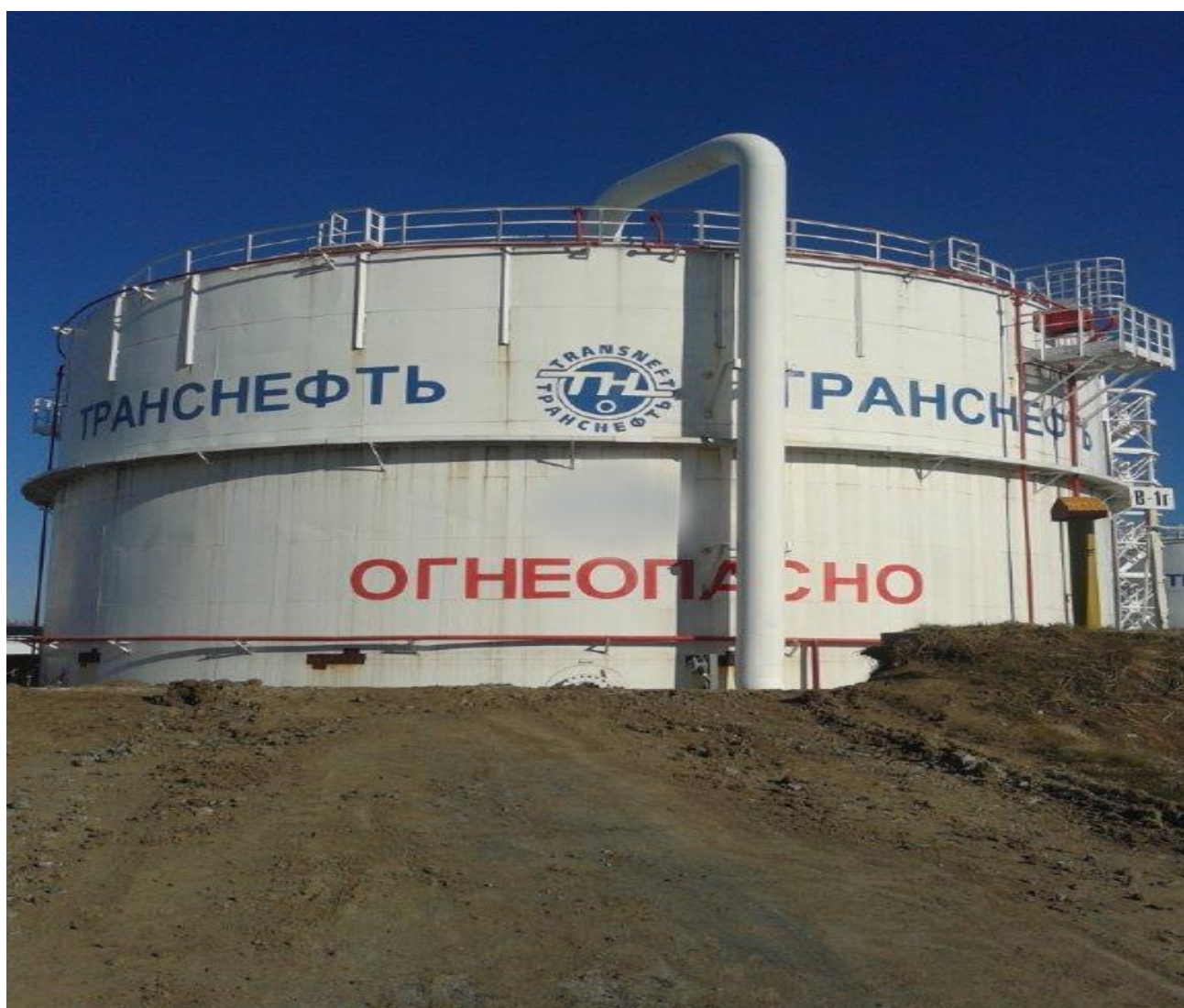
Рисунок 1 – Общий вид резервуара вертикального стального цилиндрического РВС-5000

Общий вид резервуаров вертикальных стальных цилиндрических РВС-5000, РВС-20000, РВСП-20000, РВСПК-50000 и РВСПА-50000 представлен на рисунках 1, 2, 3, 4, 5.