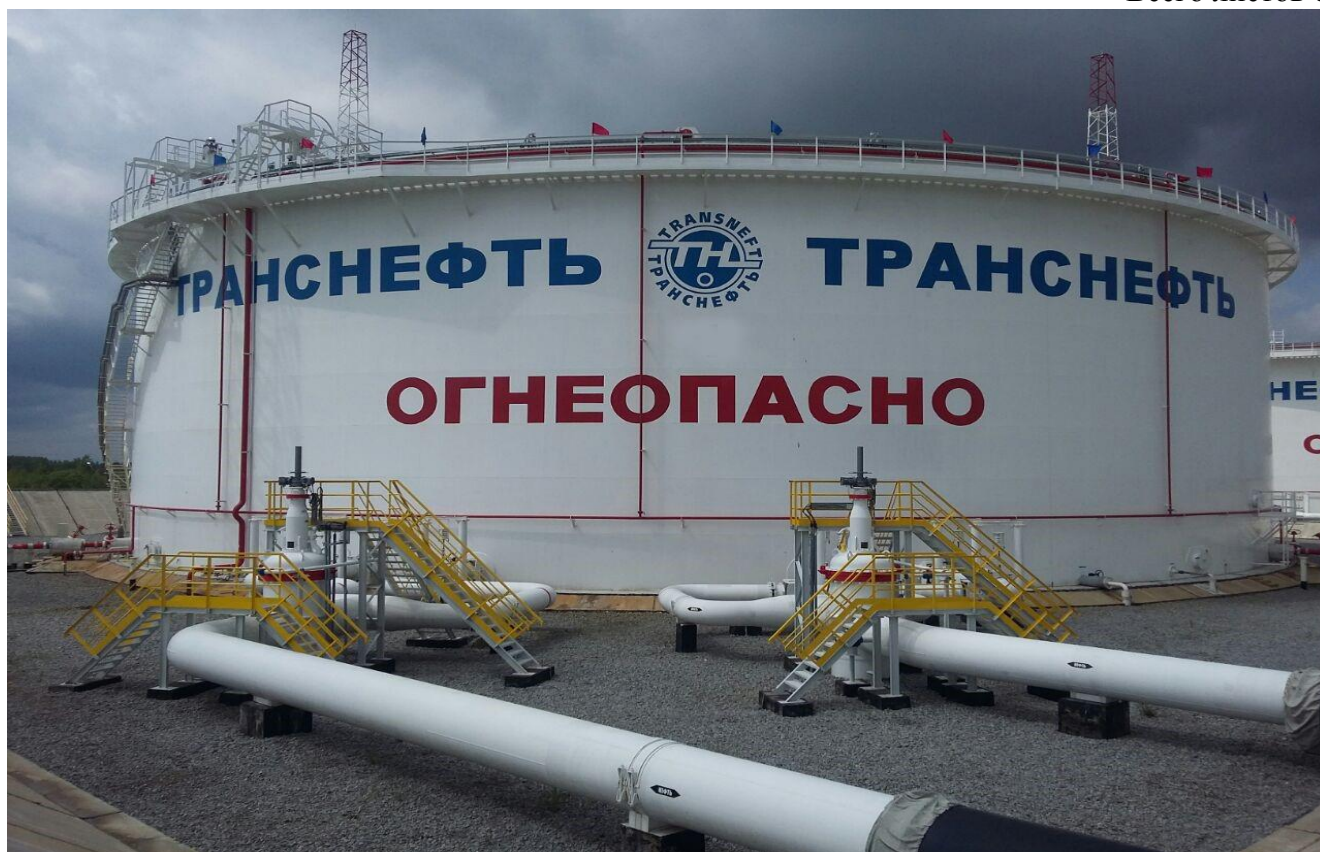
Рисунок 4 – Общий вид резервуара вертикального стального цилиндрического РВСПК-50000