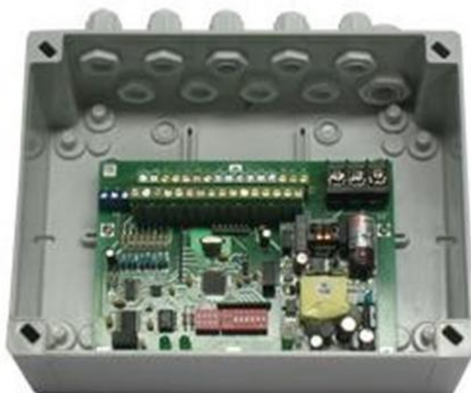
Рисунок 3 – Общий вид блока опроса термоподвесок БОТ-01