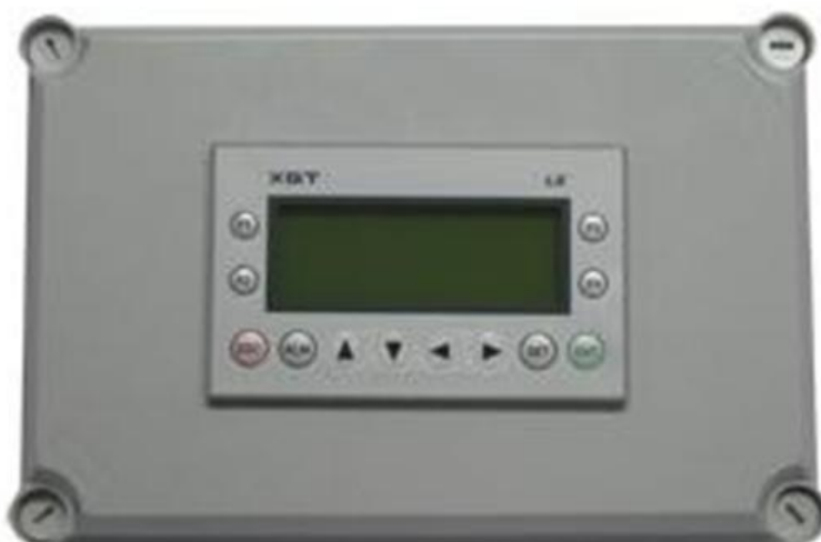
Рисунок 2 – Общий вид контроллера УК-01