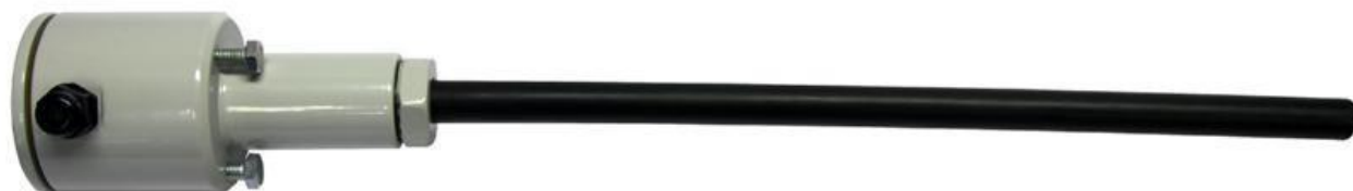
Рисунок 4 – Общий вид термоподвески типа ТП-01-XX-YY