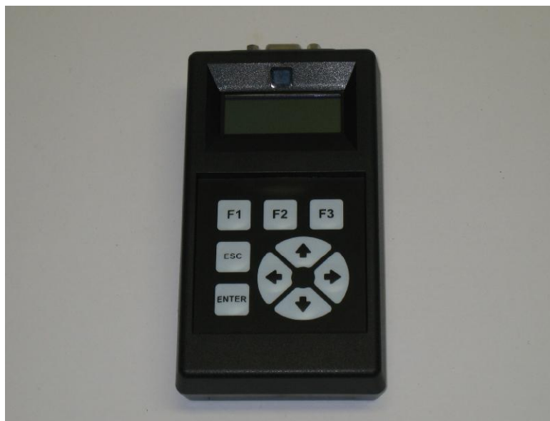
Рисунок 6 – Общий вид ручного считывателя РС-01